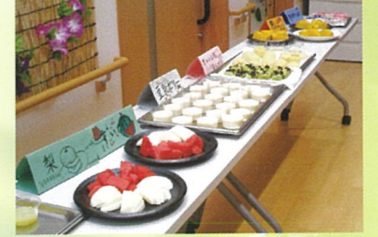
■施設内でのカフェバイキング