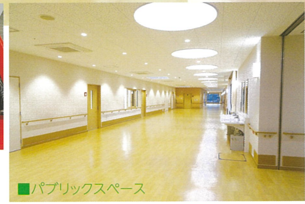
■パブリックスペース